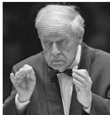
Musica contemporanea Martino Traversa con la rivista. Nelle foto piccole, dall'alto, Luigi Nono e Pierre Boulez.